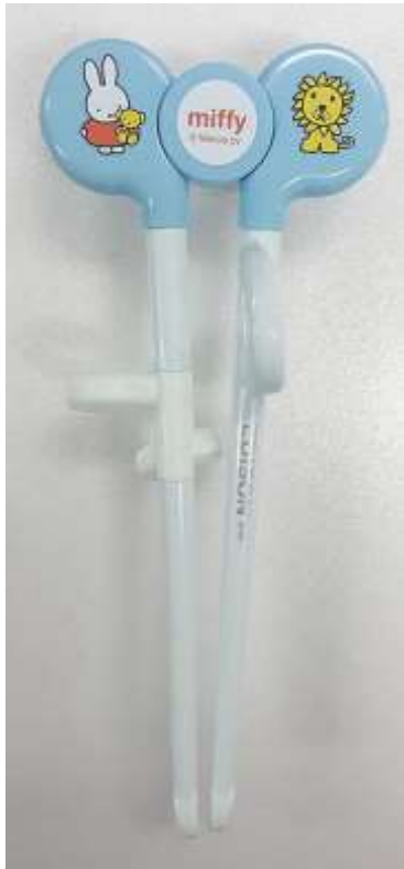
6. エジソンのお箸miffy (ブルー) 正面写真