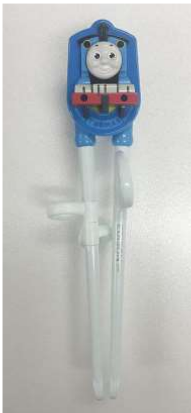
7. エジソンのお箸 きかんしゃトーマス : トーマス(右手用) 正面写真